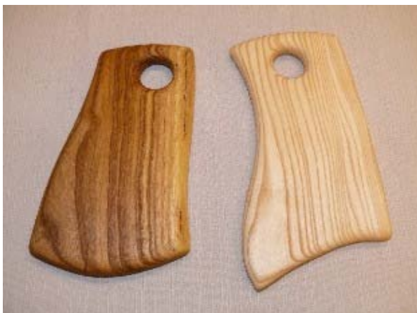
diverse Formen, kunstvoll gestaltet