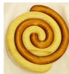
„Kleine Schnecke“ 16 cm Durchm.