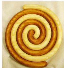
„Große Schnecke“ 21 cm Durchm.