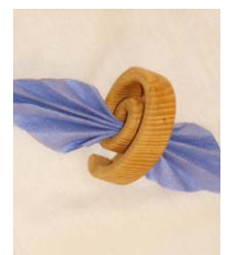
„Serviette Schnecke“ 9 cm Durchm.

-durch verschiedene Kombinationen und Erweiterungen, für mehrere oder größere Töpfe u. Pfannen verwendbar-